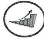
ความมั่งคั่ง