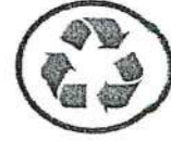
ความยั่งยืน