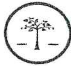
ความมั่นคง